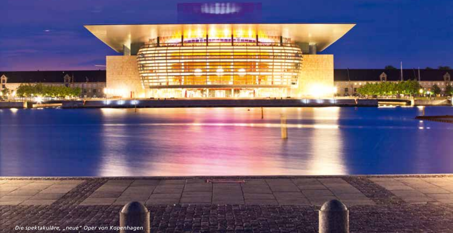
Die spektakuläre, „neue“ Oper von Kopenhagen