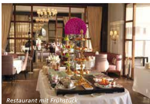
Restaurant mit Frühstück