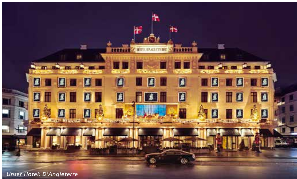
Unser Hotel: D'Angleterre