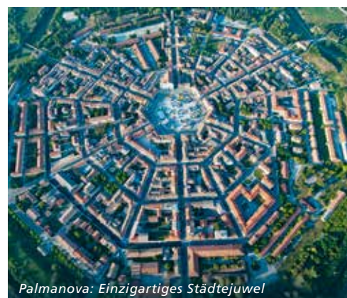
Palmanova: Einzigartiges Städtejuwel