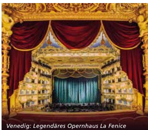
Venedig: Legendäres Opernhaus La Fenice