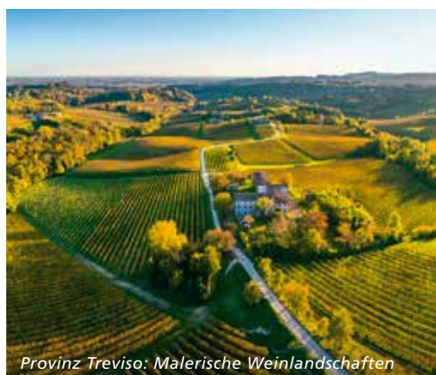
Provinz Treviso: Malerische Weinlandschaften

fast denken in Österreich zu sein ... Malerisch schön sind die Paläste an der Uferpromenade mit ihren herrlichen Fassaden und der barocken Bauwerke wie die Kirche S. Maria Maggiore. Nach der Stadtführung individuelles Mittagessen und etwas Zeit zur freien Verfügung. Am frühen Nachmittag treffen wir uns wieder und unternehmen einen Ausflug nach Aquileia. Die Basilika Santa Maria Assunta in Aquileia ist eine der ältesten Kirchen