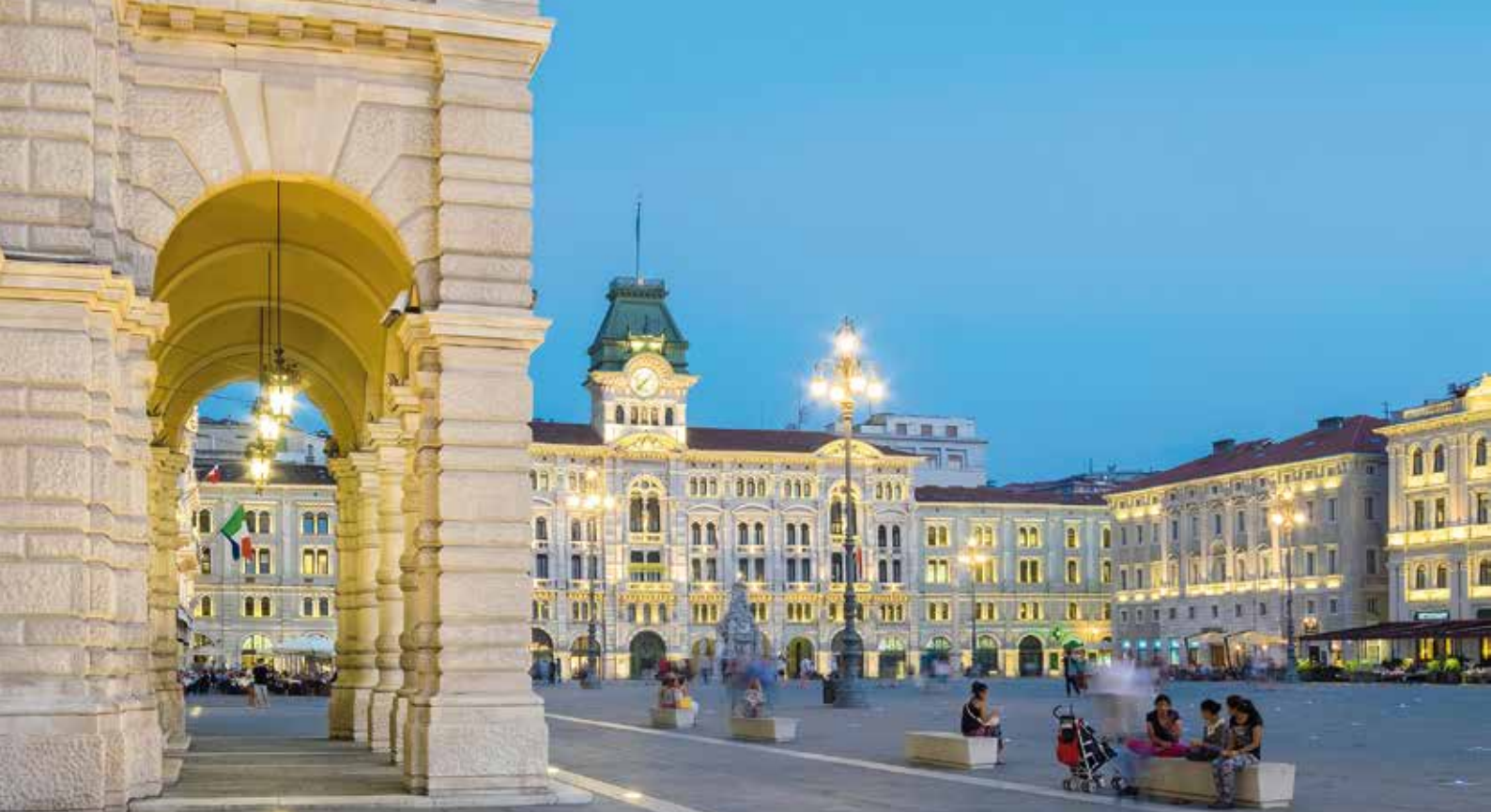
Triest: Die „Piazza dell'Unità d'Italia“ ist der Salon der Stadt und der größte zum Meer hin geöffnete Platz Europas